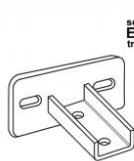
serie EAMPT trasversale